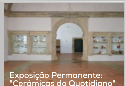
Exposição Permanente: "Cerâmicas do Quotidiano"