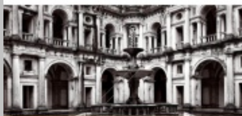
The Convent of Christ and the Renaissance culture in Tomar

Convent of Christ, Tomar, Portugal July 10 th to July 21 st , 2017